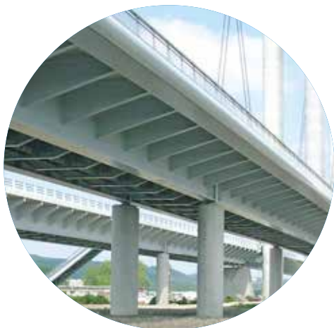
Viaduc d'accès au Pont Gustave Flaubert - ROUEN (76)