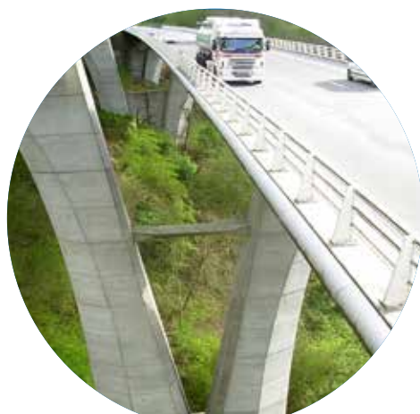
Remplacement joints de chaussée Viaduc de ROGERVILLE (76)