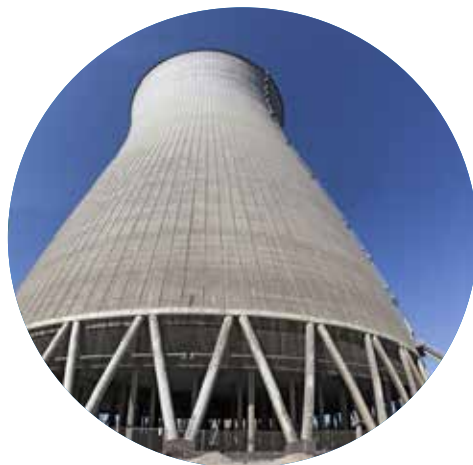
Réparation des aéroréfrigérants CNPE BUGEY (01)