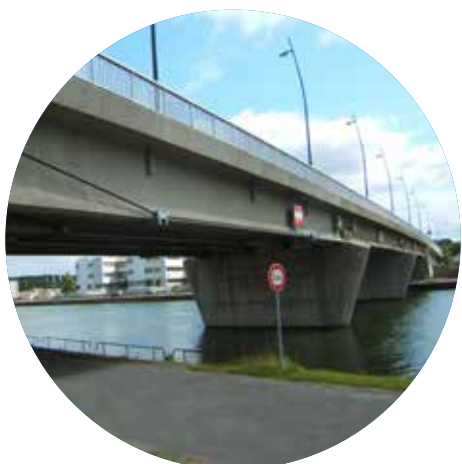
Pont Neuf SENS (89)