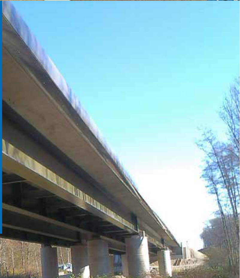
Viaduc du Picot - Lure (70)

La synergie avec les autres métiers du groupe offre la possibilité de se positionner sur de nombreux marchés spécifiques et de répondre à l'ensemble des phases clés d'un projet.