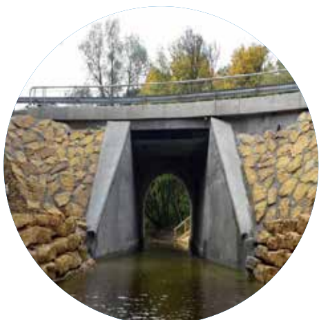
Réhabilitation du Pont Lebrun VALLEROY (54)