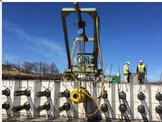
Précontrainte par post tension

Rigueur, technicité et engagement sont des valeurs que nous affirmons à chaque étape des projets ambitieux qui nous sont confiés.