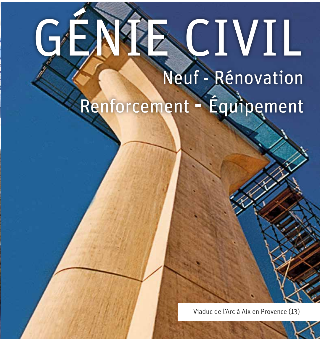
Viaduc de l'Arc à Aix en Provence (13)

BAUDIN CHATEAUNEUF dispose de toutes les compétences et du matériel nécessaire pour la réalisation ou la rénovation d'ouvrages de génie civil, tous travaux de gros œuvre en Travaux Publics, toute forme d'ouvrages d'art et d'ossatures porteuses auprès des clients publics comme privés.