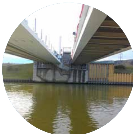
Renforcement de la vanne NPN Canal de DONZERE (82)