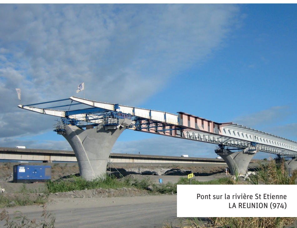
Pont sur la rivière St Etienne LA REUNION (974)