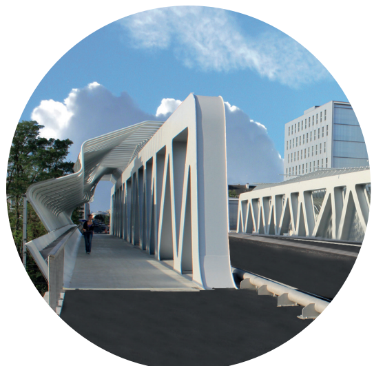
Pont de la Matte à SAINT NAZAIRE (44)