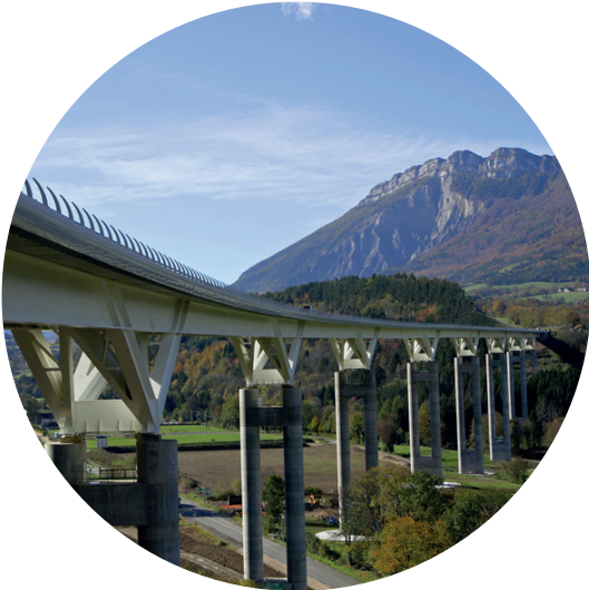
Viaduc de Monestier de CLERMONT (38)