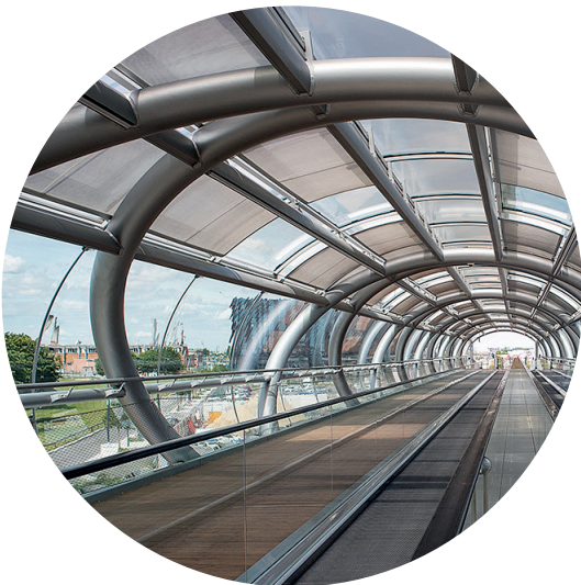
Passerelle COEUR D'ORLY (94)