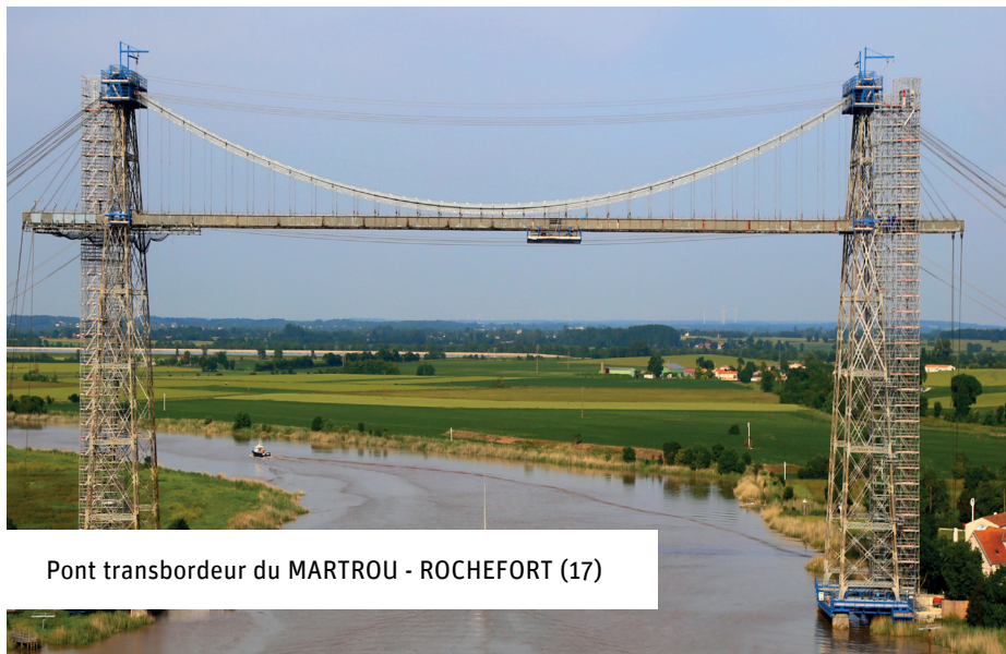
Pont transbordeur du MARTROU - ROCHEFORT (17)