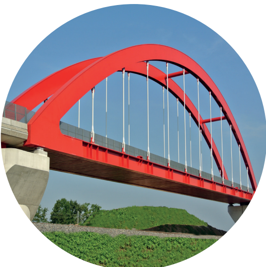
Bowstring raccordement LGV Est à VENDENHEIM (67)