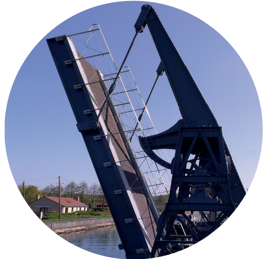
Pont-levis THOMAS à BEUVRY (62)