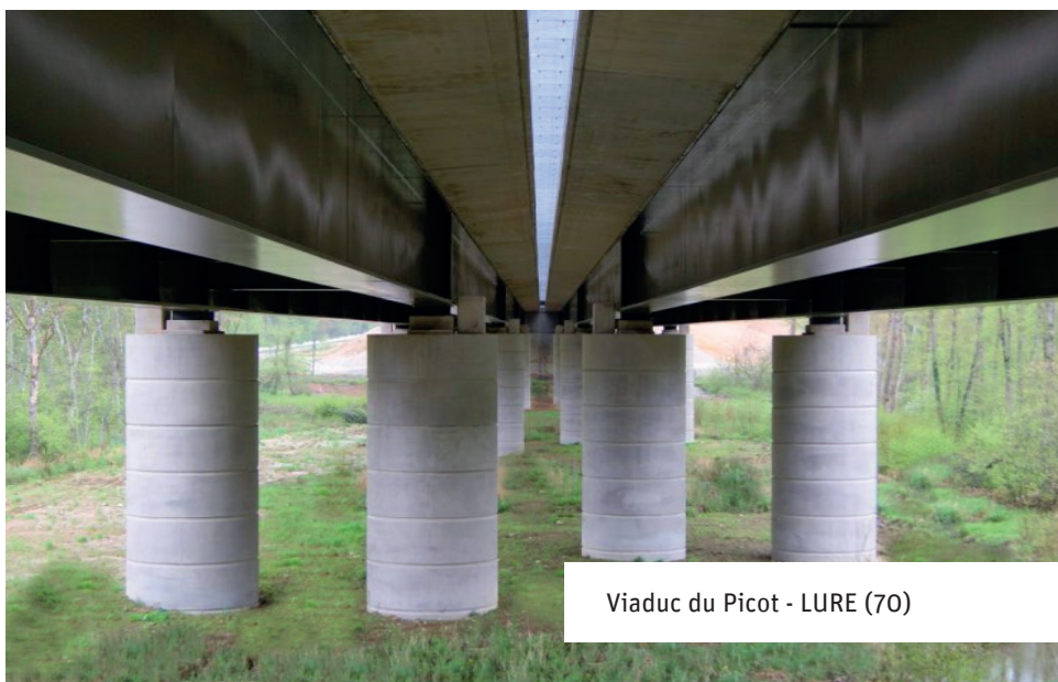
Viaduc du Picot - LURE (70)

De la conception aux travaux de finition, du génie civil aux équipements, de l'ouvrage neuf au renforcement structurel, nous intégrons tous les enjeux de votre projet .