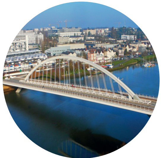
Pont sur la Maine à ANGERS (42)