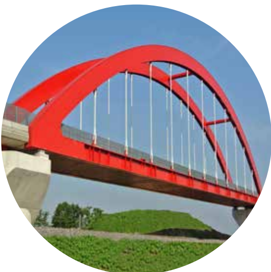
Bowstring raccordement LGV Est à VENDENHEIM (67)