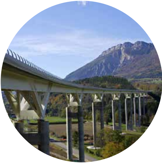
Viaduc de Monestier de CLERMONT (38)