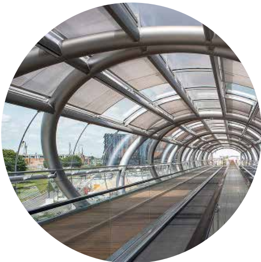
Passerelle COEUR D'ORLY (94)