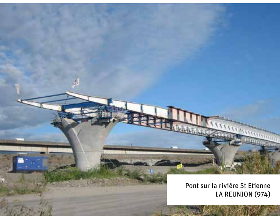
Pont sur la rivière St Etienne LA REUNION (974)