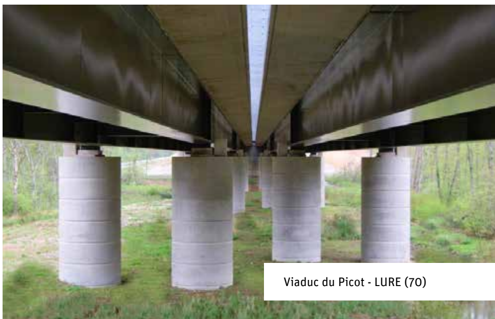
Viaduc du Picot - LURE (70)

De la conception aux travaux de finition, du génie civil aux équipements, de l'ouvrage neuf au renforcement structurel, nous intégrons tous les enjeux de votre projet .