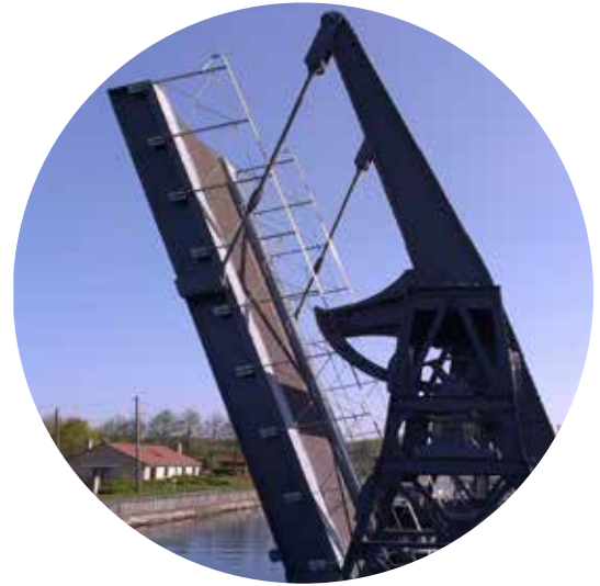
Pont-levis THOMAS à BEUVRY (62)