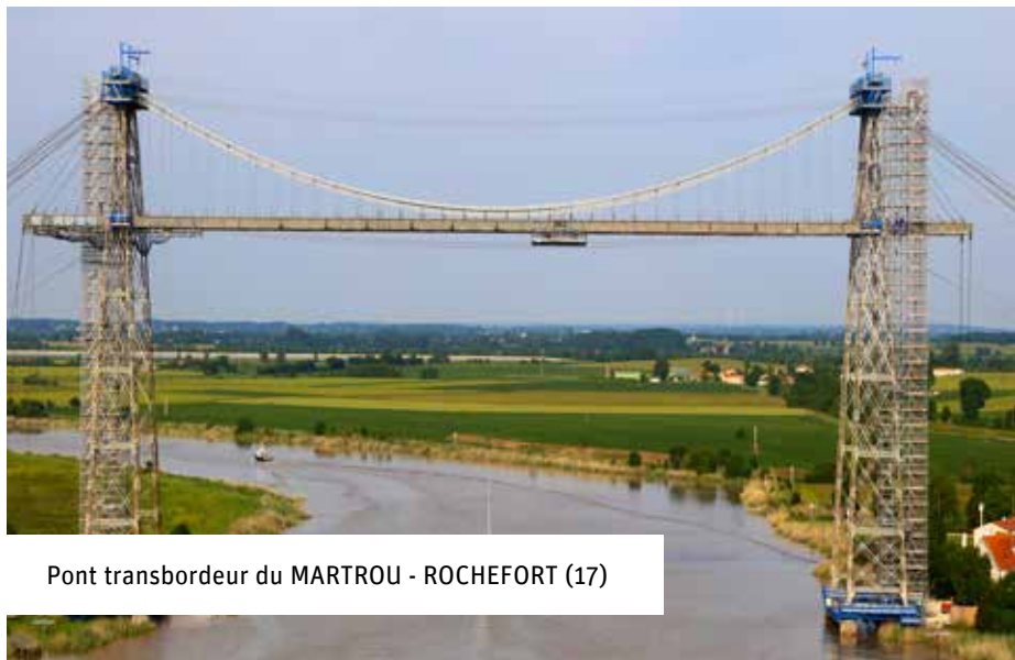
Pont transbordeur du MARTROU - ROCHEFORT (17)