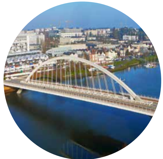
Pont sur la Maine à ANGERS (49)