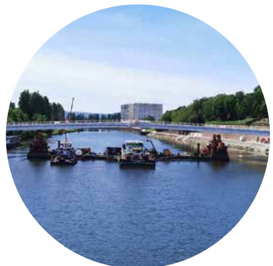
Passerelle de Thionville (57)