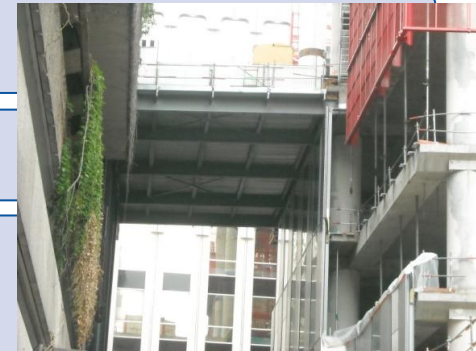
Vue sur la passerelle d'accès