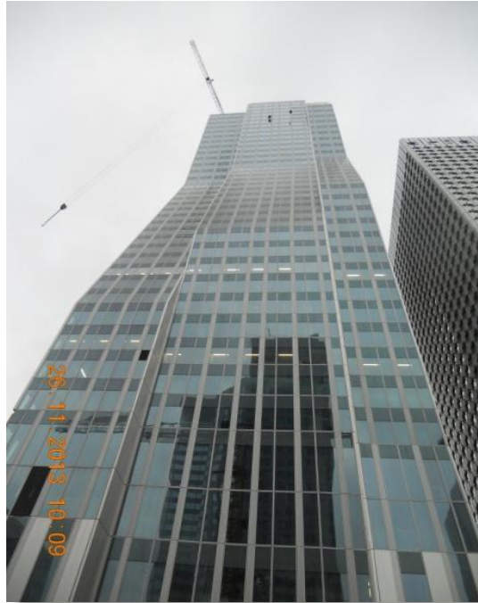
Vue sur la Tour