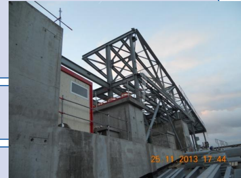
Vue sur la coiffe métallique