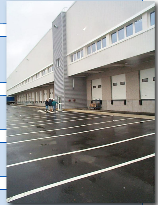
perspective des mezzanines file 1 de K à L