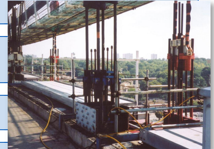
Systeme de vérinage sur les anciennes et les nouvelles suspentes

Les équipes de BC ont ainsi procédé à la déshumidification des câbles porteurs, à l'application de profils de PEHD, au wrapping des câbles et à la mise en place de bandes d'Hypalon garantissant l'étanchéité à l'eau et à l'air de la nappe de câbles.