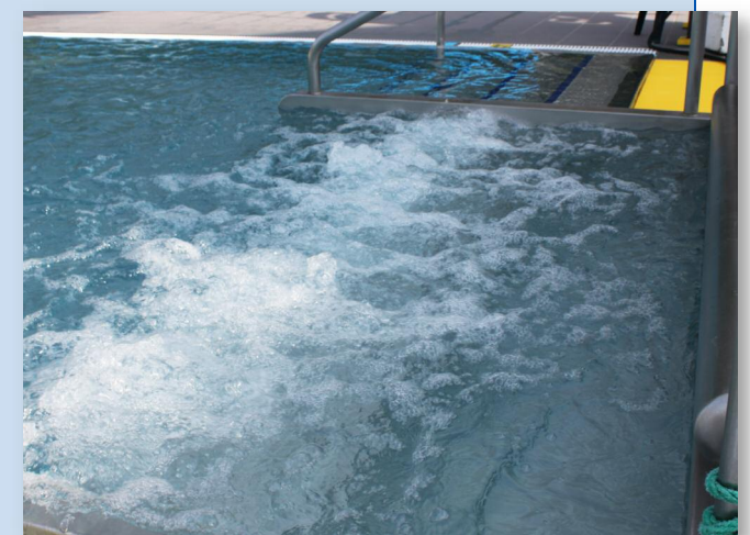
Banquette à bulles