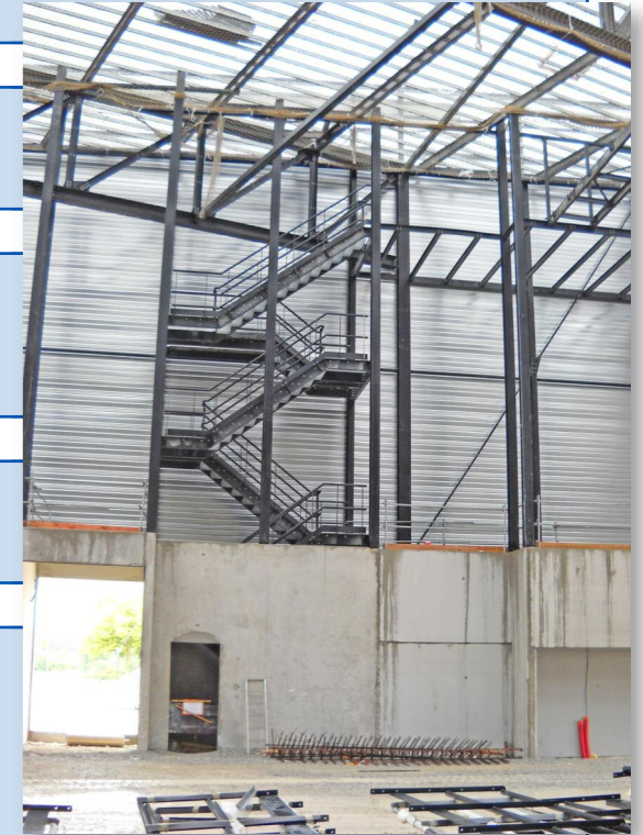
Escalier d'accès aux passerelles scéniques