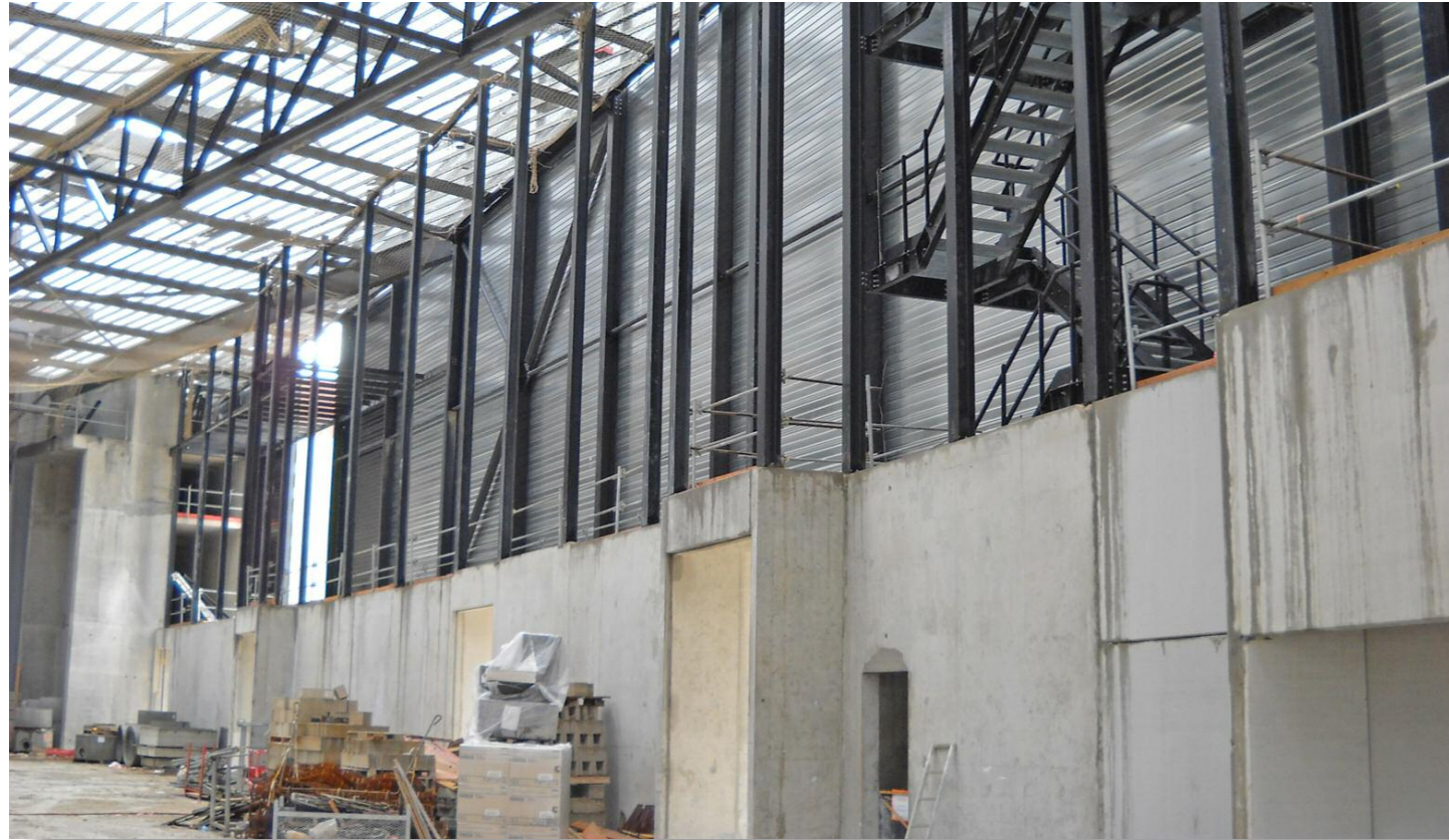
Façade Sud intérieure