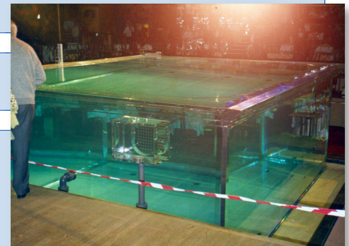
Piscine en essais sur scène (40 t d'eau)