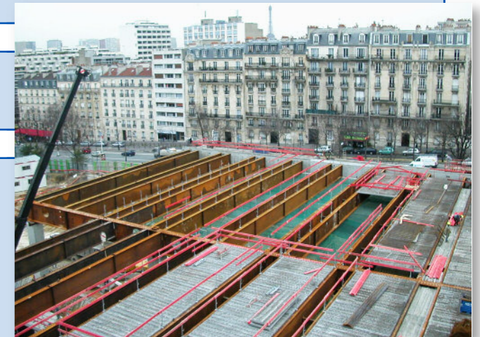
Plancher en cours de réalisation