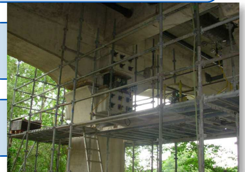
Création du massif de vérinage pour changement appareils d'appuis