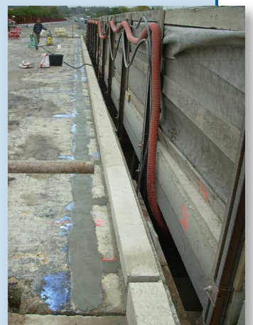
Réalisation des longrines