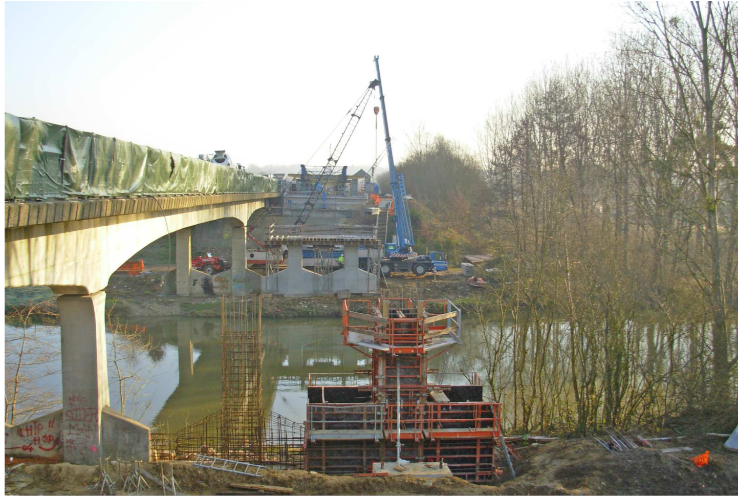
A gauche : ouvrage en cours de restructuration A droite : ouvrage en construction