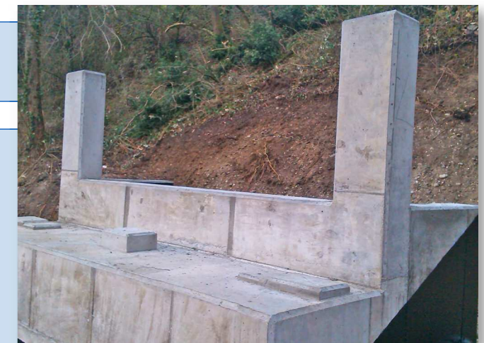
Appui après bétonnage