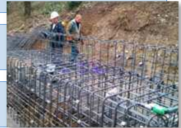
Ferrailage des appuis