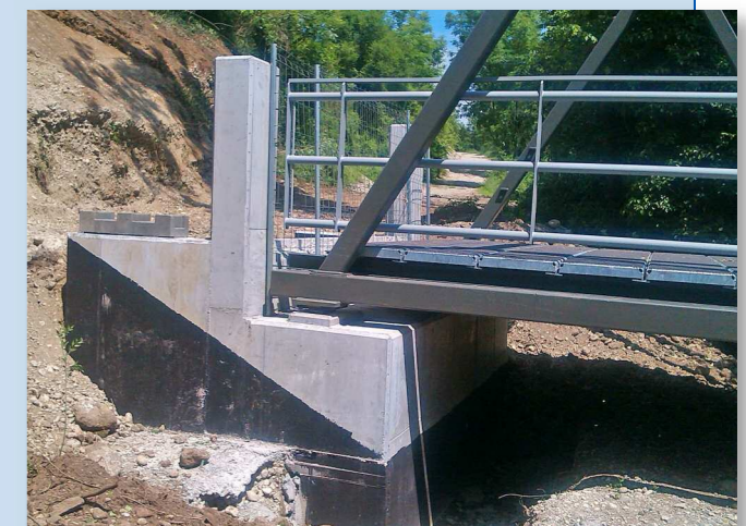
Appui après mise en place de l'ouvrage