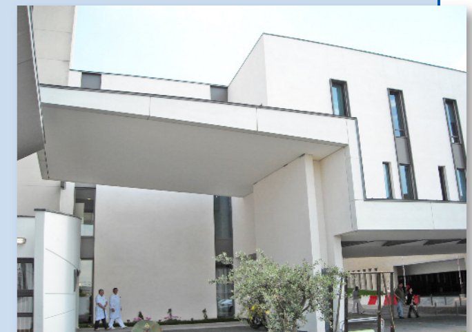
Auvent façade Est