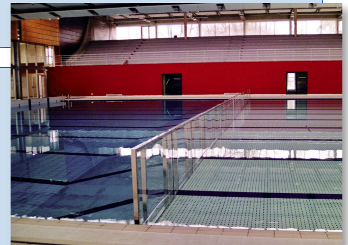
Fond relevé et garde-corps en place