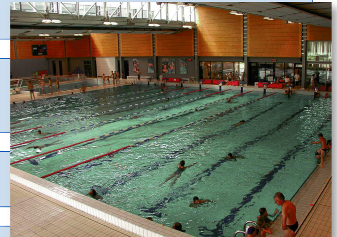
Fond en position basse