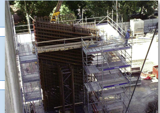
Cage de ferrailage de la poutre arrière rive gauche