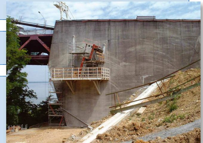
Vue d'ensemble de la culée rive droite