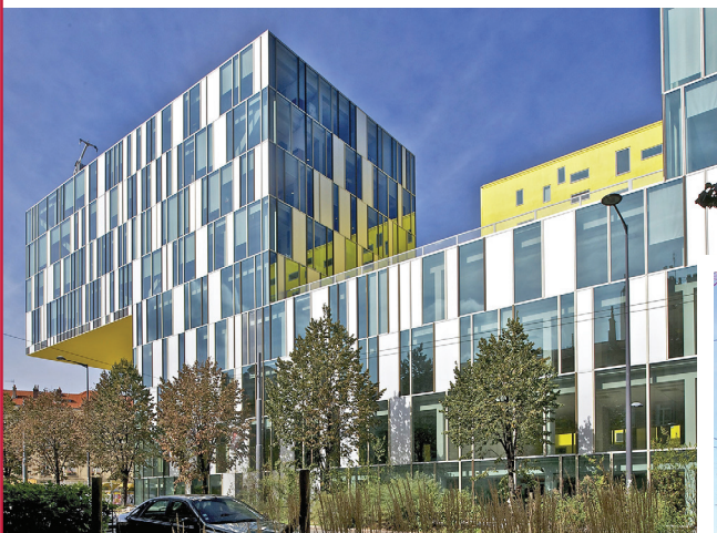
▲ CITÉ DES AFFAIRES | SAINT-ETIENNE (42) :

Maître d'ouvrage : COGEDIM ALTAREA Maître d'œuvre : MANUELLE GAUTRAND ARCHITECTURE / BET KHEPHREN / ARCORA