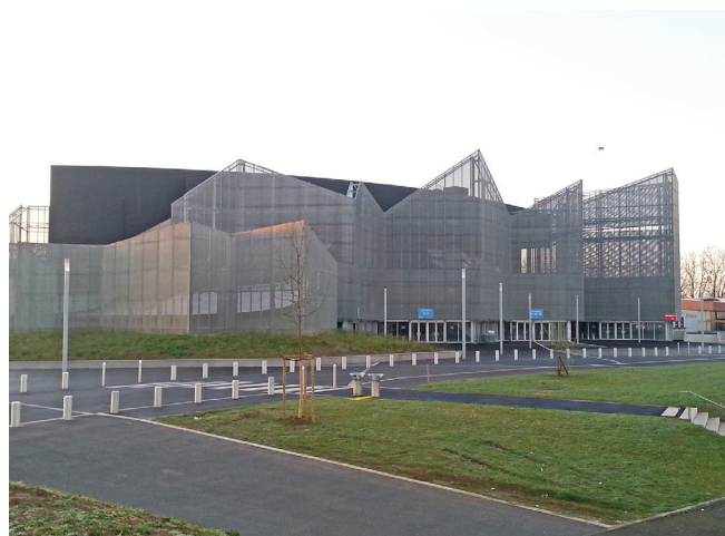
▲ SALLE DE SPECTACLES "ANOVA" | ALENÇON (61) :

Maître d'ouvrage : COMMUNAUTÉ URBAINE D'ALENÇON Maître d'œuvre : BUREAU ETCO Architecte : JEAN-PIERRE LOTT