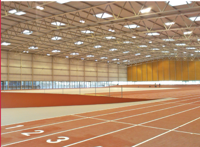
▲ RÉNOVATION DU CENTRE NATIONAL DES SPORTS DE LA DÉFENSE | FONTAINEBLEAU (77) :

Maître d'ouvrage : QUARTIER SPORT DÉFENSE Maître d'œuvre : BARTHELEMY GRINOT