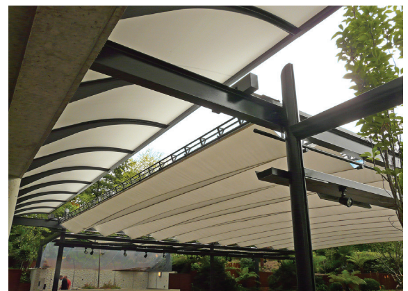
▲ STADE ROLAND GARROS - COUVERTURES MOBILES SUR LES TERRASSES DU CLUB DES LOGES DU COURT SUZANNE LENGLEN | PARIS (75) :

Maître d'ouvrage : COMMUNAUTÉ D'AGGLOMÉRATION D'ORLÉANS VAL DE LOIRE Maîtrise d'œuvre : GROUPEMENT HYL PAYSAGISTE (MANDATAIRE) / M. ARNAUD YVER (ARCHITECTE) / EGIS / ISL / COSIL