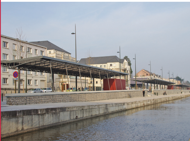
▲ AMÉNAGEMENT QUAI DU ROI - HALLES DU MARCHÉ | ORLÉANS (45) :

Maître d'ouvrage : SAS LA GATINAISE Maître d'œuvre : SARL ALLAIN MAITRE / COBI ENGINEERING