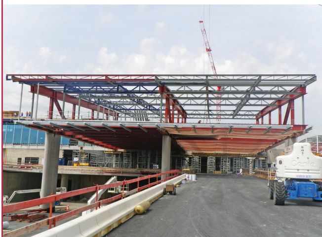
▲ ZONE CENTRALE S4 - MÉGAPOUTRE ZONE AIR FRANCE | AÉROPORT DE ROISSY CHARLES DE GAULLE (95) :

Maître d'ouvrage : EDF Maître d'œuvre : EDF CNEPE