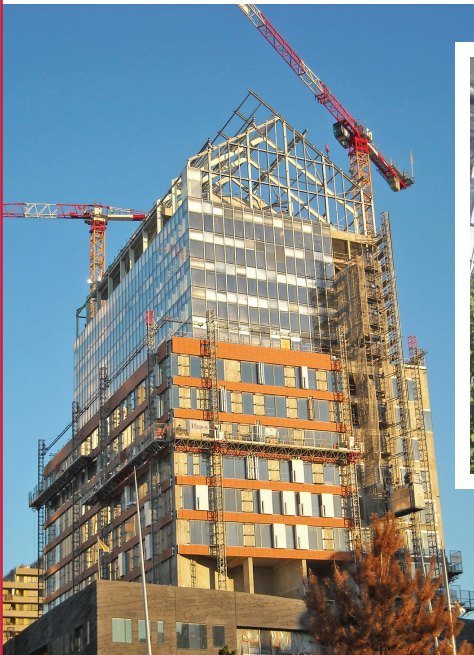
▲ VERRIÈRE TOUR C1 "HORIZONS" | BOULOGNE-BILLANCOURT (92) :

Maître d'ouvrage : HINES PRELUDE Maître d'œuvre : ICADE - ARCOBA Architecte : ATELIERS JEAN NOUVEL