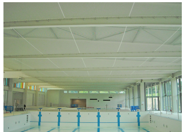
▲ CENTRE NAUTIQUE | SAINT-ETIENNE (42) :

Maître d'ouvrage : QUARTIER SPORT DÉFENSE Maître d'œuvre : BARTHELEMY GRINOT