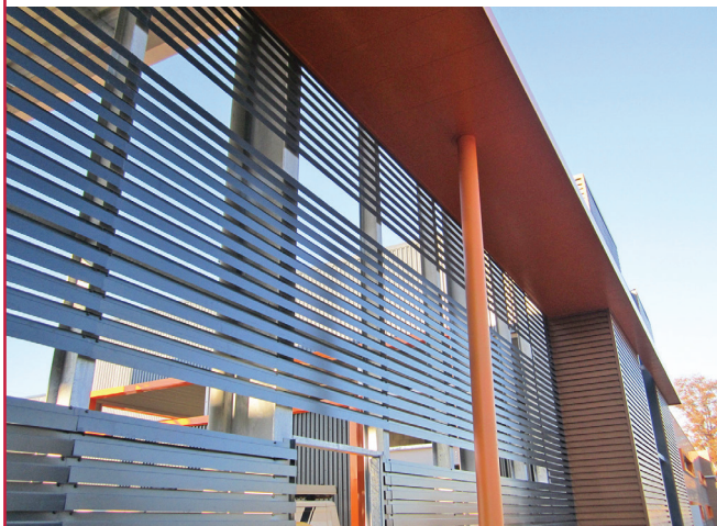
▲ CONSTRUCTION D'UN BÂTIMENT INDUSTRIEL | INGRÉ (45) :

► BC réalise des bâtiments dans tous les domaines d'activités, dans des environnements classiques ou à forte contrainte de mise en œuvre (co-activité, sécurité, ...). Par ailleurs, BC est certifiée MASE et CEFRI pour répondre aux exigences fortes en matière de Qualité-Sécurité-Environnement sur ce type de prestations.