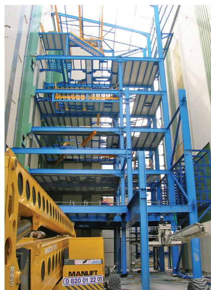
▲ BÂTIMENT HECTOR | SALINDRES (30) :

Maître d'ouvrage : SCI DU PÔLE Maître d'œuvre : SARL D'ARCHITECTURE L'HEUDÉ ET L'HEUDÉ