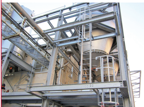
▲ CHARPENTE DES BÂTIMENTS 31/36/40 ET 40 BIS AIRE 53 DANS LE CADRE DU PROJET PICSEL | SAINT-AUBIN-LÈS-ELBEUF (76) :

Maître d'ouvrage : ELENZY GDF SUEZ Maître d'œuvre : JACOBS ENGINEERING