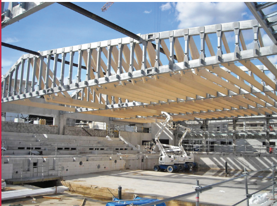
▲ RESTRUCTURATION DU CENTRE AQUATIQUE D'ANNEMASSE (74) :

► BC participe à la construction d'ossatures métalliques plus atypiques dans différents domaines de façon à répondre aux souhaits des clients et de leurs maîtres d'œuvre d'intégrer l'acier dans leurs projets.