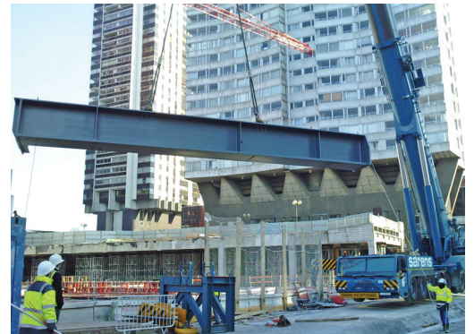
▲ CENTRE COMMERCIAL BEAUGRENELLE | PARIS (75) :

Maître d'ouvrage : SCI BEAUGRENELLE / STÉ GENICA Maître d'œuvre : VALODE ET PISTRE