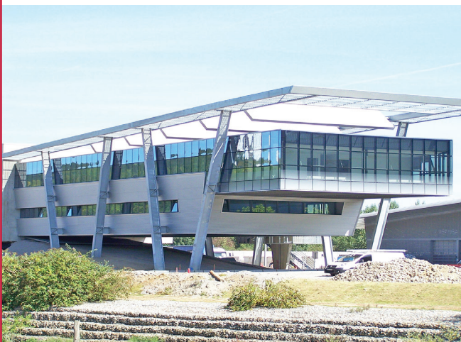
▲ SIÈGE ADMINISTRATIF DU SMEDAR | GRAND-QUEVILLY (76) :

Maître d'ouvrage : VILLE DE SAINT-ETIENNE Maîtrise d'œuvre : BVL ARCHITECTURE / M. ALEX MADINIER (architecte) / BET CD2I