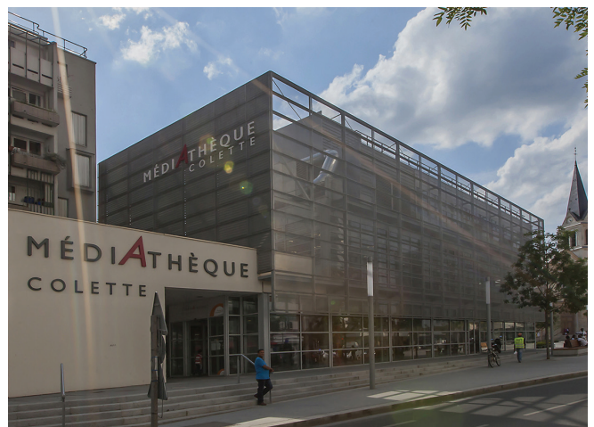
▲ MÉDIATHÈQUE COLETTE | EPINAY-SUR-SEINE (93) :

Maître d'ouvrage : S.M.E.D.A.R. Maître d'œuvre : M. GODIVIER (ARCHITECTE) / A.I.S.