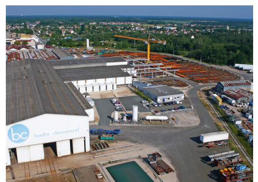
▲ SITE DE CHATEAUNEUF-SUR-LOIRE (45)