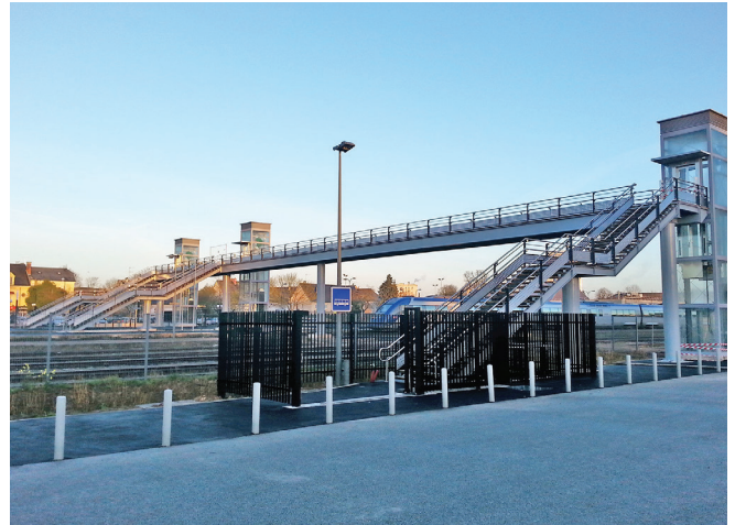
▲ PASSERELLE D'ACCÈS PMR | GARE SNCF D'ALENÇON (61) :

Maître d'ouvrage : VILLE D'ANNEMASSE Maître d'œuvre : BVL ARCHITECTURE