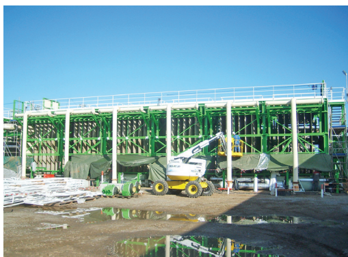
▲ RÉNOVATION GAZÉFIEURS | MONTOIR-DE-BRETAGNE (44) :

Maître d'ouvrage : AXENS Maître d'œuvre : AXENS associé au BET ECS