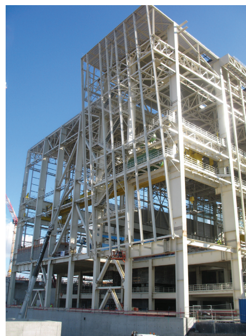
▲ CONSTRUCTION DE LA SALLE DES MACHINES | EPR DE FLAMANVILLE (50) :

Maître d'ouvrage : COMMUNAUTÉ DE COMMUNES CASTELROUSSINE Maître d'œuvre : CABINET BLOND & ROUX