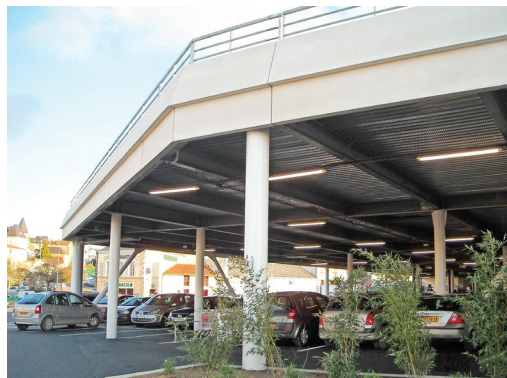
▲ CONSTRUCTION PARKING HYPER U | PARTHENAY (45) :

Maître d'ouvrage / Maître d'œuvre : SNCF