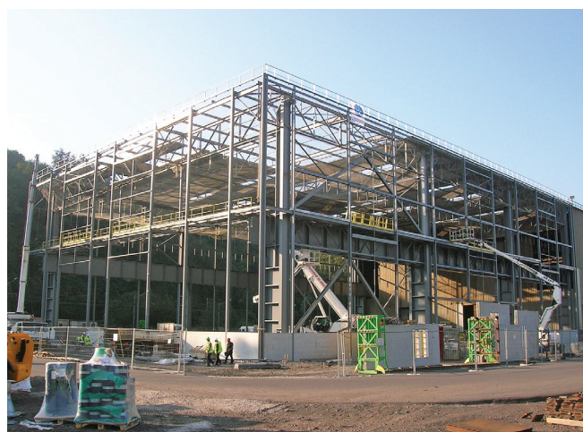
▲ EXTENSION HALLE V | RIVE-DE-GIER (42) :

Maître d'ouvrage : SANOFI AVENTIS Maître d'œuvre : SNC LAVALIN / ERAS