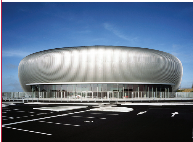
▲ ZÉNITH "LE TARMAC" | CHÂTEAUROUX (36) :

Maître d'ouvrage : COMMUNAUTÉ DE COMMUNES CASTELROUSSINE Maître d'œuvre : CABINET BLOND & ROUX