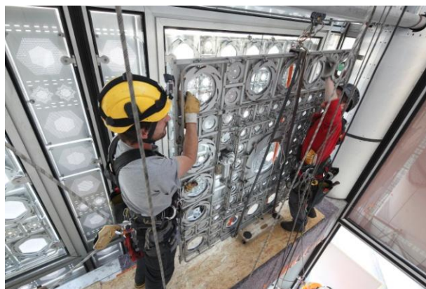
Travaux de dépose et repose à l'IMA