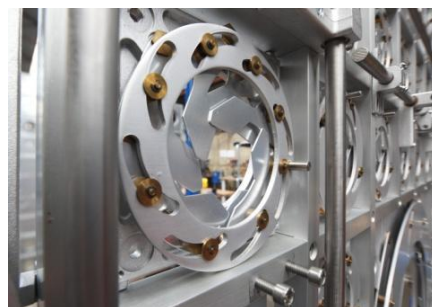
Travaux de restauration en atelier