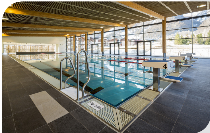
• Piscine municipale de La-Salle-les-Apes (05) Maîtrise d'œuvre : CHABANNES & PARTENAIRES

Tous ces points sont importants pour assurer au maître d'ouvrage et au maître d'œuvre la qualité de la prestation et le respect des délais.