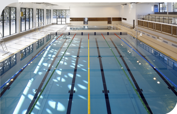
• Piscine Bertran de Born à Périgueux (24) Maîtrise d'œuvre : BVL ARCHITECTURE