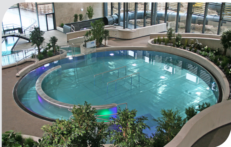
• Complexe aquatique "Aguasud" de Differdange (LUXEMBOURG) Maître d'œuvre : M3 ARCHITECTES