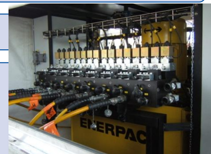
Centrale de vérinage 16 voies PCB