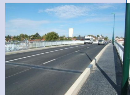
Vue au dessus de l'ouvrage