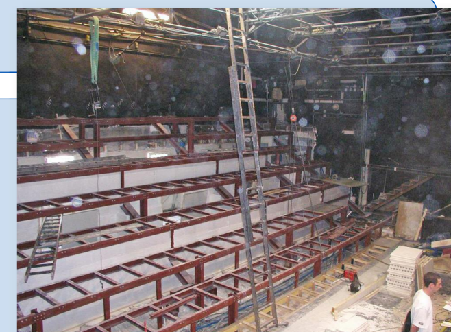
Salle étage : reconstruction des ossatures de gradins