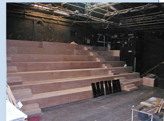
Salle étage : revêtement bois des gradins