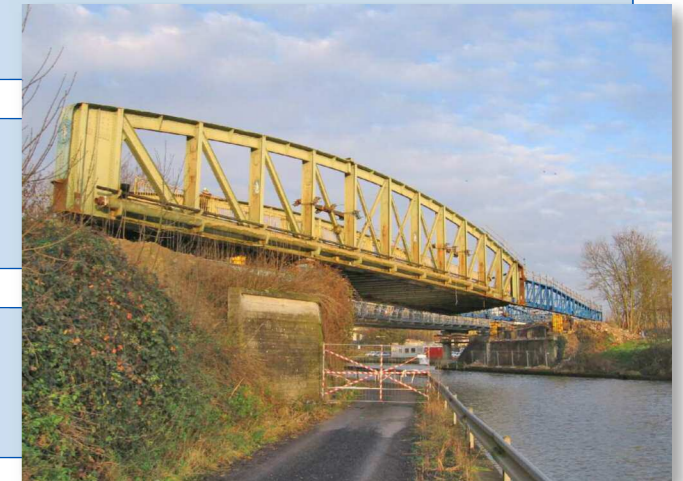
Délancement de l'ancien ouvrage