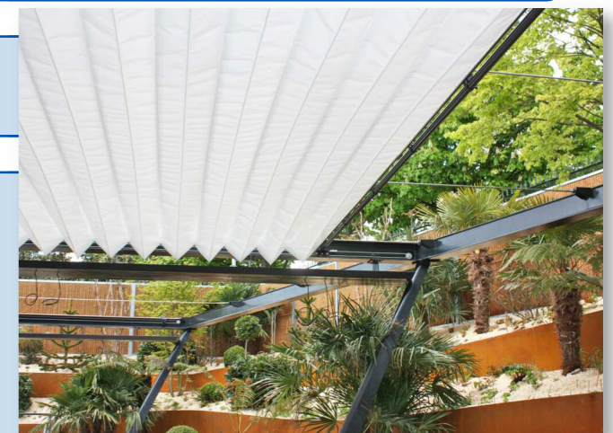
Couverture du restaurant