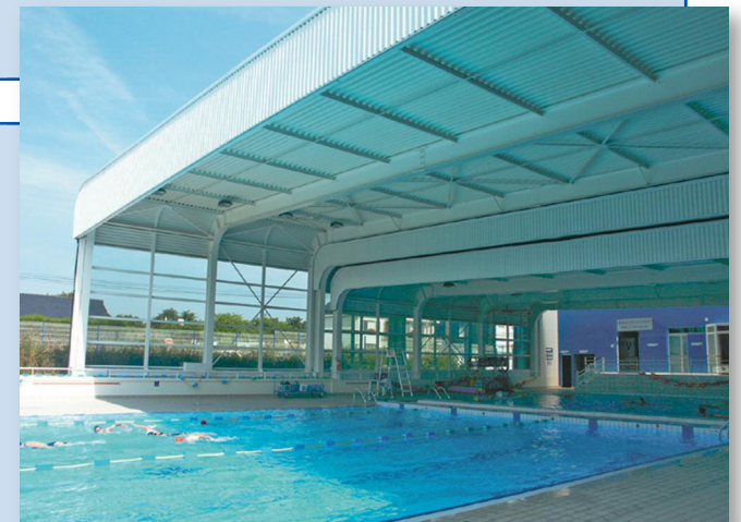
Toiture en cours d'ouverture