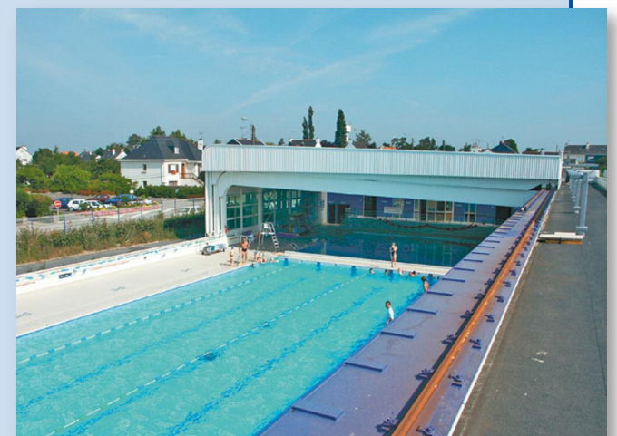
Toiture totalement ouverte