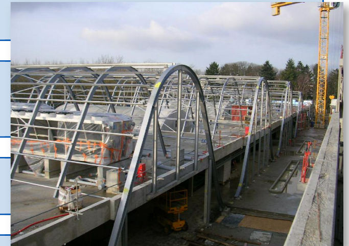
Montage de la zone Galeria