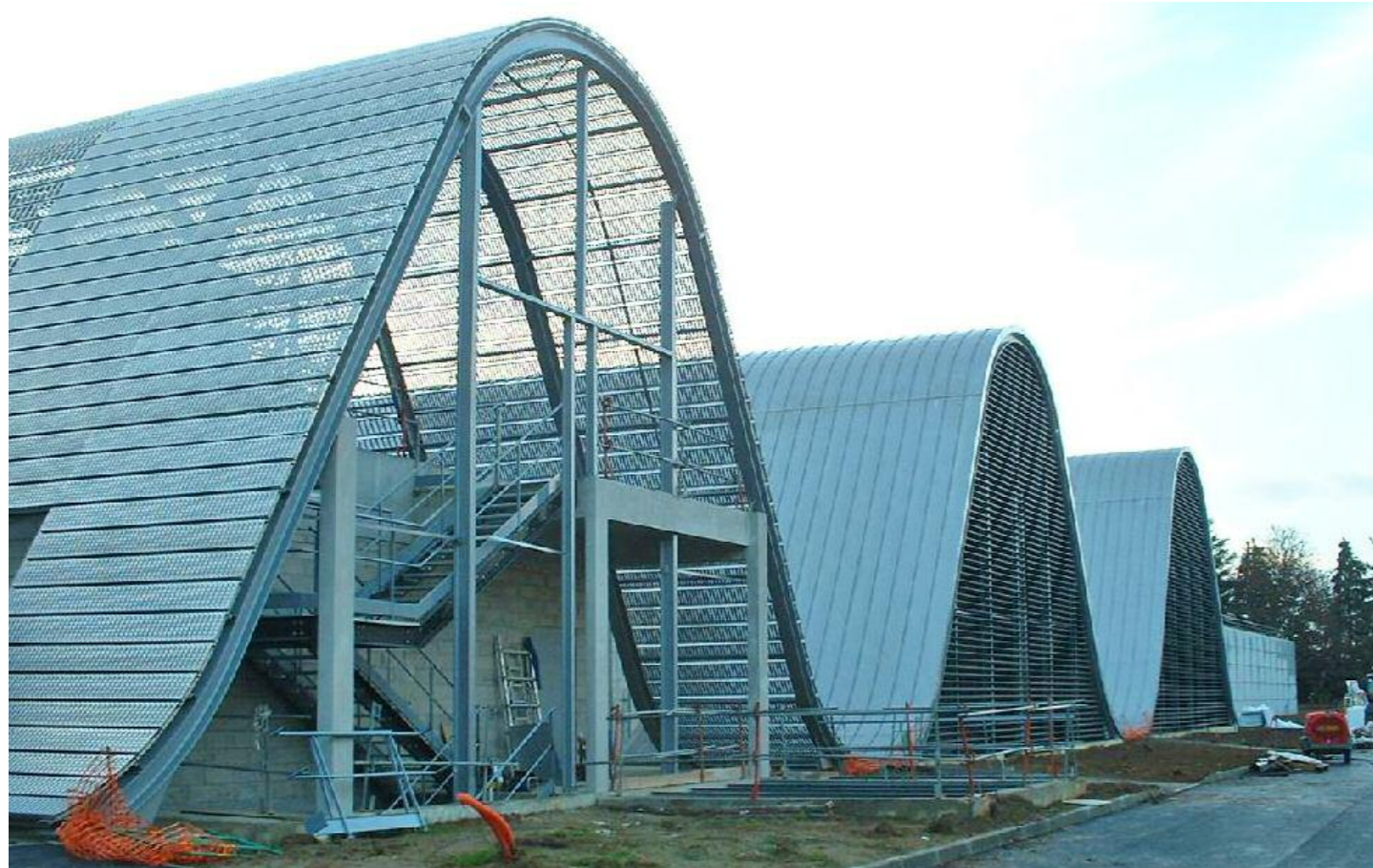
Vue sur la façade Ouest des toitures ondulées