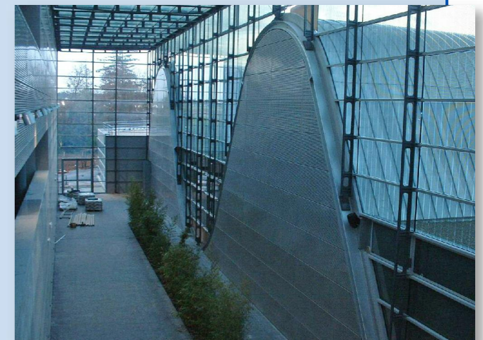
Vue sur les arbalétriers cintrés situés à l'intérieur de l'espace Galeria