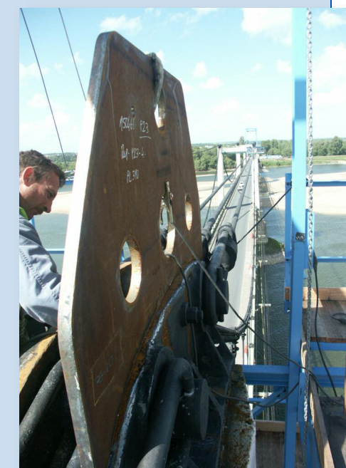
Dispositif de remplacement des câbles