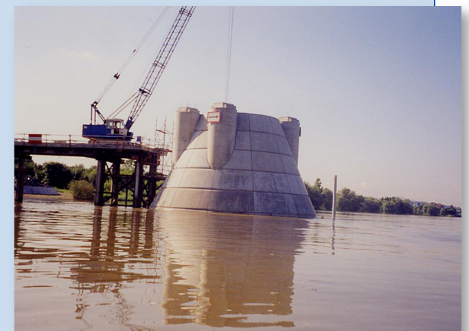
Fin de la construction d'une pile du pont