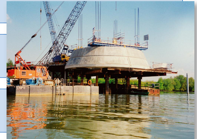
Fabrication et immersion progressive d'une pile (650 t)