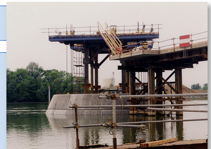
Clavage d'une pile sur 10 pieux de fondation (diamètre : 1,60 m)