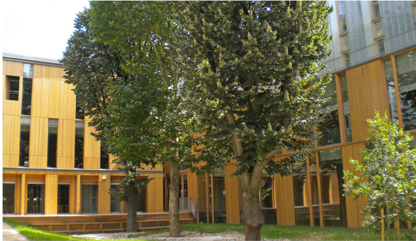
Bâtiments B et C