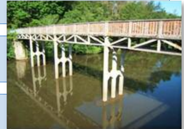
Ancienne passerelle avant démolition