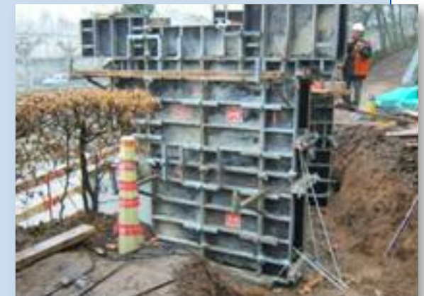
Coffrage d'une culée