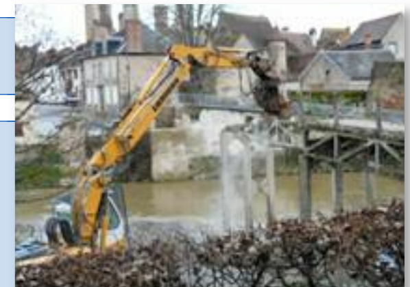
Démolition de l'ancienne passerelle