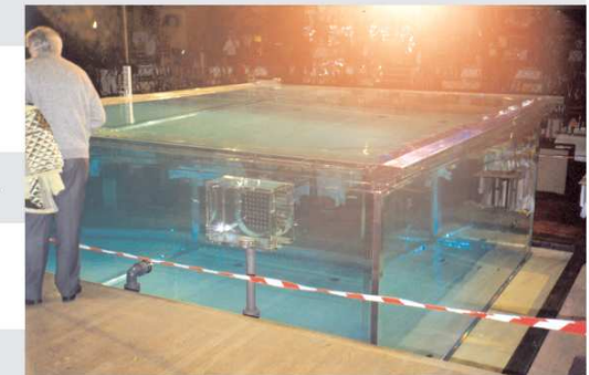
piscine en essais sur scène (40 t. d'eau)