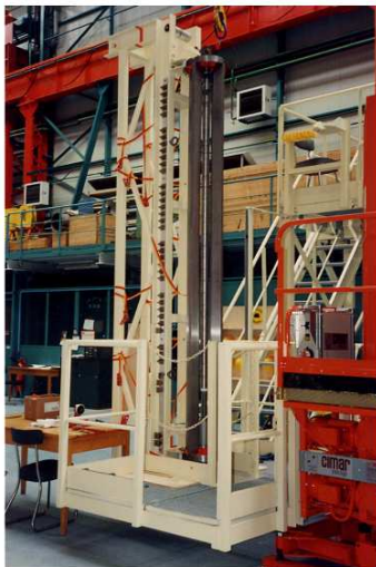
presse de frettage