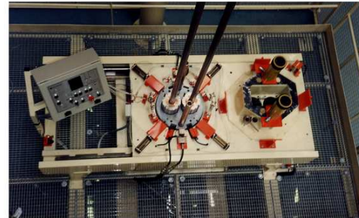
table d'empilage et banc de pressage