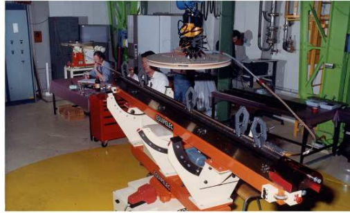
V MACHINE À FRETTER V