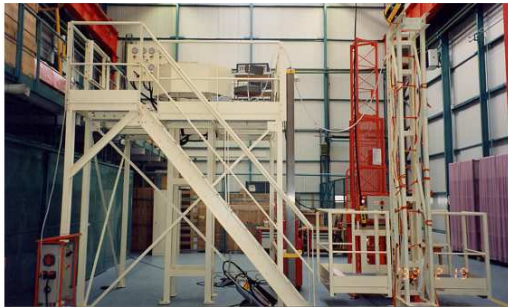
banc d'assemblage des tôles