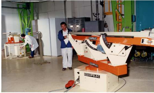
V MACHINE À BOBINER LHC V