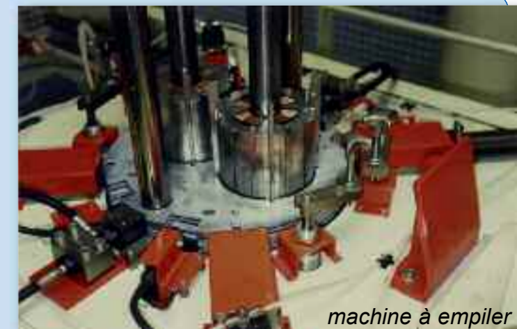
machine à empiler