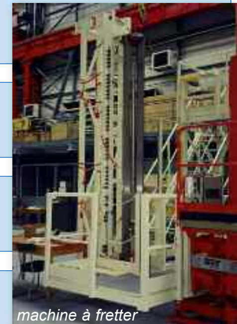
machine à fretter

Machine conçue pour l'assemblage de deux pôles d'aimants supra, avec l'empilage et le pressage des masses métalliques et le contrôle de hauteur. La mise en place et le pressage des masses métalliques sont semi-automatiques, ainsi que le contrôle précis de cet empilage. Ces aimants sont destinés au CERN de Genève.