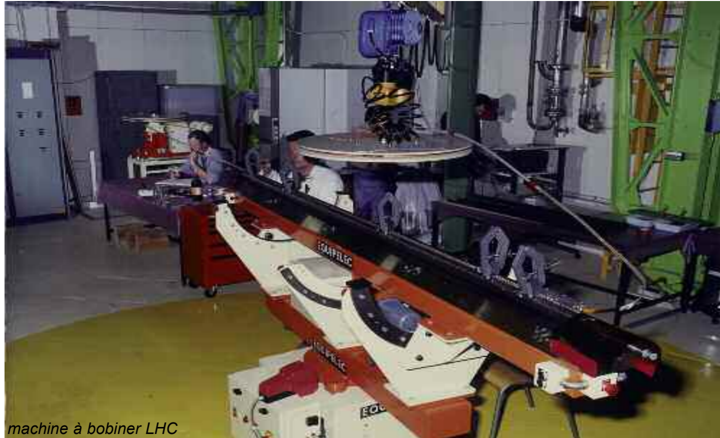
machine à bobiner LHC