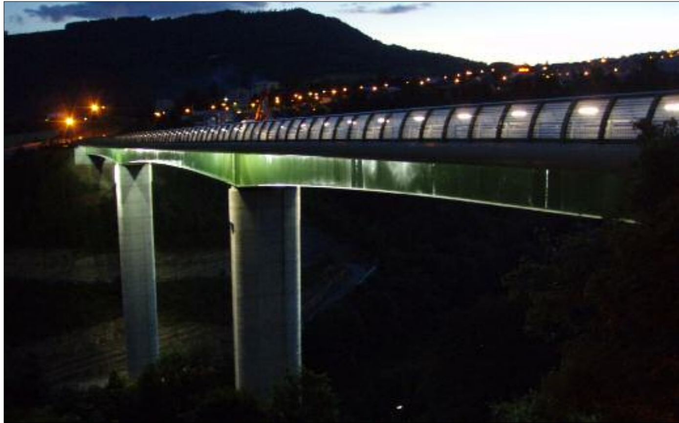
Élévation du Viaduc de Rieucros