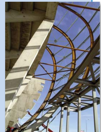
Détail des arcs cintrés