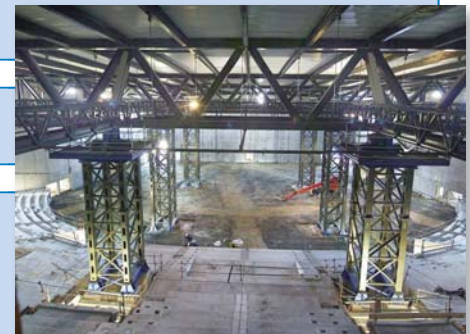
Montage des poutres maîtresses