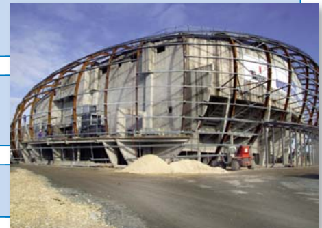
Montage de la charpente