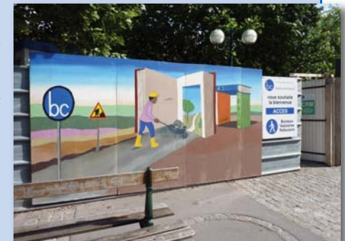
Une fresque a été réalisée sur la clôture du chantier, elle est restée en place pendant toute la durée des travaux