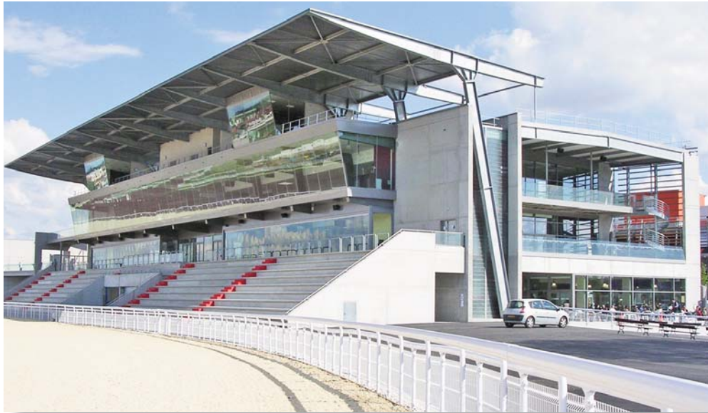
Tribunes de l'hippodrome