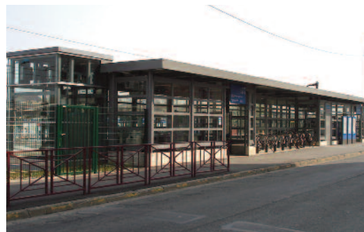
4- GARE TRAM/TRAIN AULNAY-BONDY - BONDY (93)