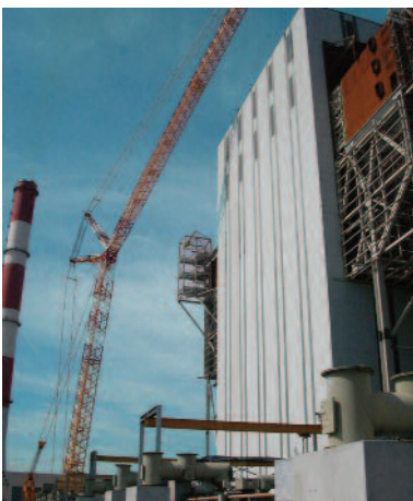
2- RÉNOVATION DE LA CENTRALE EDF DE CORDEMAIS (44)