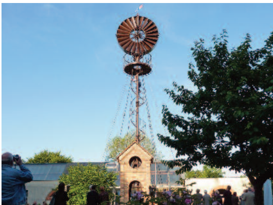
1- ÉOLIENNE BOLLÉE - SAINT-JEAN-DE-BRAYE (45)