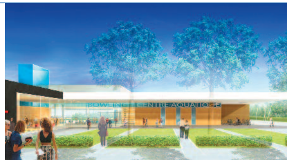
1- COMPLEXE BOWLING-CENTRE AQUATIQUE - HESDIN (62) BAIL EMPHYTÉOTIQUE ADMINISTRATIF (BEA)

Les PPP permettent des formes variées de montage juridique associant la Personne Publique avec des partenaires financiers et les entreprises en charge de la construction et de la maintenance. Le partenaire privé est maître d'ouvrage. La Personne Publique assure le contrôle du projet.