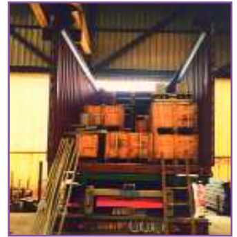
Tunisie : montage sous trafic, un savoir-faire BC