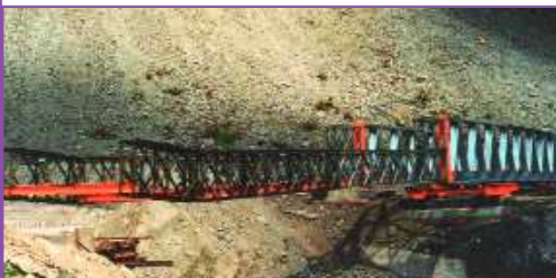
Guyane : lancement pont PIMM

> Cette offre de montage s'inscrit dans une volonté de qualité totale et de service au client