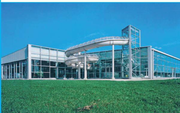
Maître d'ouvrage : DISTRICT RURAL DU VÉRON Maître d'œuvre de réhabilitation : CABINET NET HOUDOT Architecte : M. LE CHEVREL