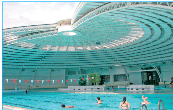
Maître d'ouvrage : VILLE DE BLOIS Maître d'œuvre de réhabilitation : ARCOS ARCHITECTURE Architecte : M. BERNARD SCHOELLER