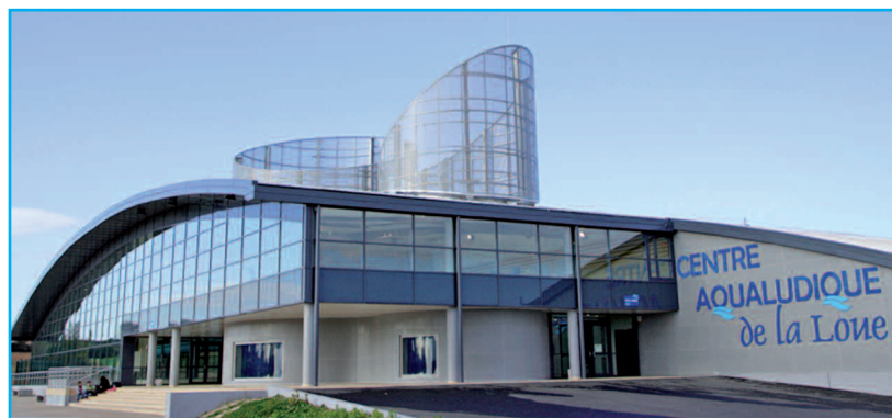
Maître d'ouvrage : COMMUNAUTÉ D'AGGLO- MÉRATION DE MONTLUÇON Architecte : GROUPEMENT ATELIER CHABANNE / CABINET MARET