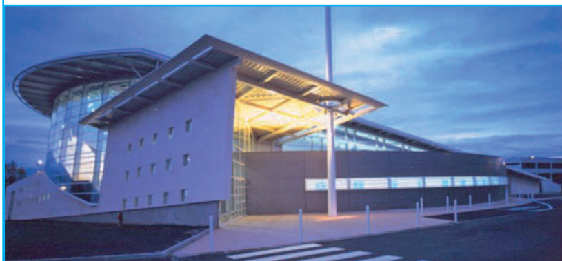
Maître d'ouvrage : SADEL Architecte : CABINET ATRIUM