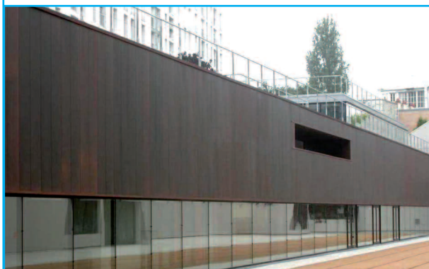
Maître d'ouvrage : SAGI VILLE DE PARIS Architecte : CHRISTINE ET DOMINIQUE CAR- RIL