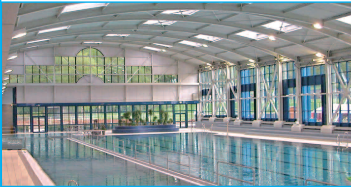
Maître d'ouvrage : ADMINISTRATION COMMUNALE DE PÉTANGE Architecte : ATELIER DU SUD (M. RADESTIC)