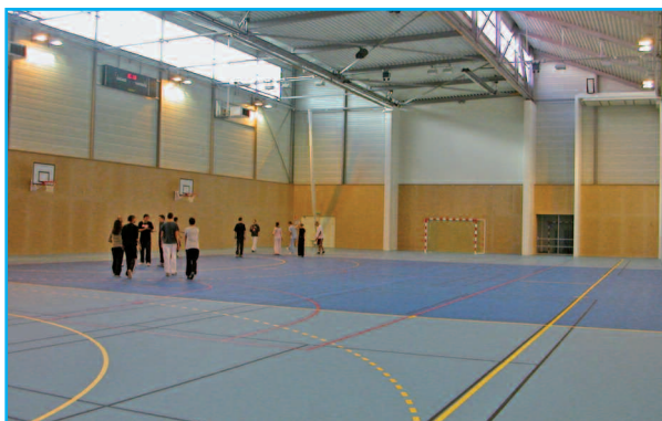
Maître d'ouvrage : VILLE DE KREMLIN BICÊTRE Architecte : AGENCE CRR ARCHITECTES AS- SOCIES