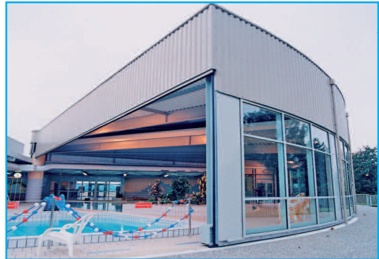
Maître d'ouvrage : COMMUNAUTÉ DE COMMUNES DE MARCKOLSHEIM Architecte : ATELIER ARCOS