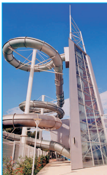
Maître d'ouvrage : COMMUNAUTÉ DE COMMUNES DE L'AIGLE Architecte : CABINET HOUDOT