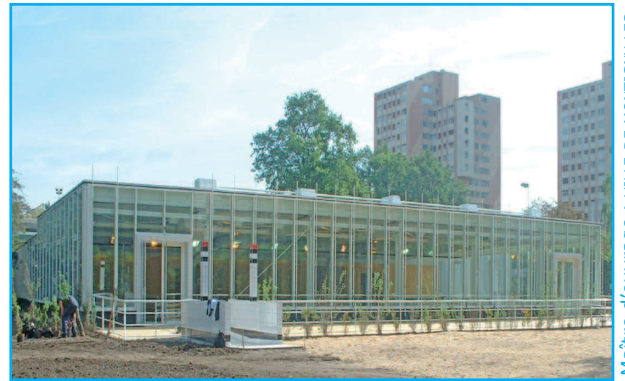
Maître d'ouvrage : VILLE DE MONTIGNY LES CORNEILLES Architecte : M. NOIR