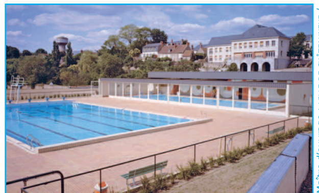
Maître d'ouvrage : VILLE DE CHÂTEAUNEUF / LOIRE Architecte : CABINET LEGRAND RABINEL DEBOUT