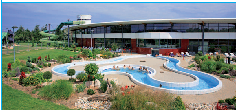
Maître d'ouvrage : VILLE DE SAINT VULBAS Architecte d'Opération : ATELIER CHABANNE Architecte de Conception : CABINET ARCOS