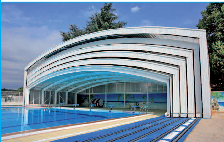
Maître d'ouvrage : MAIRIE DE LA VERPILLÈRE Architecte : GIRUS