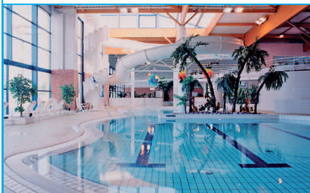
Maître d'ouvrage : VILLE DE LOUDÉAC Architecte : ATELIER ARCOS et CHATEAU