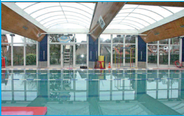
Maître d'ouvrage : COMMUNAUTÉ DE COMMUNE DE VILLE D'AVRAY Architecte : BAUDIN / GAUDRIOT